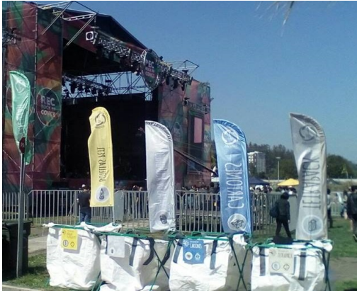
REC 2017 2.500 kg reciclados

Este año continuamos con el reciclaje inclusivo en eventos masivos, logrando recuperar un total de 2.545 kg de residuos , los que fueron en directo beneficio de los recicladores de base.