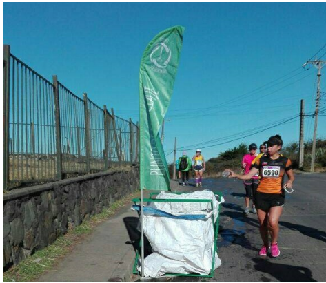
Media Maratón Coronel 25 kg reciclados