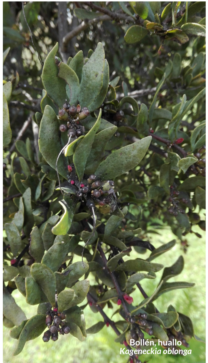
Bollén, huallo Kageneckia oblonga